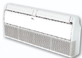
klimatyzator przypodłogowo-sufitowy w przypodłogowym wariantcie montażu